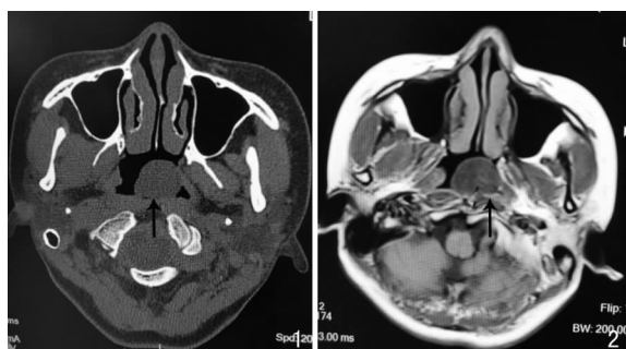
图1 鼻窦平扫CT(轴位)可见鼻咽部肿物(↑) 图2 鼻咽增强MRI(轴位)鼻咽部肿物未见强化(↑)